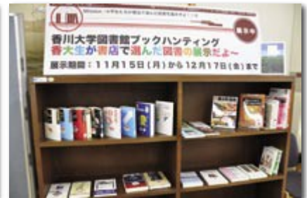
ブックハンティング （書店にて学生自ら選書する企画）

沿 革 香川大学憲章 組織 図 役員 員 役員 員 数 学部・研究科 学生の定員及び現員 前記互認定員の騰状況 入学 状 況 卒業 者 就 職 状 況 等 日本学生支援機構奨励学生数 施 設 等 公 開 講 座 国 際 交 流 財 務 状 況 産 学 官 連 携 医 学 部 附 属 病 院 関 連 教 育 病 院 機 構 等 キャンパス