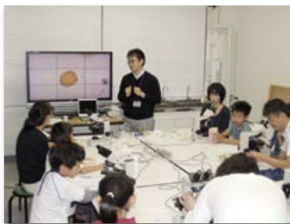
ミュージアム・レクチャー 「花粉を観察してみよう」