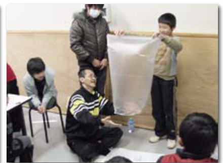
ものづくり教室 「熱気球を作ろう！」