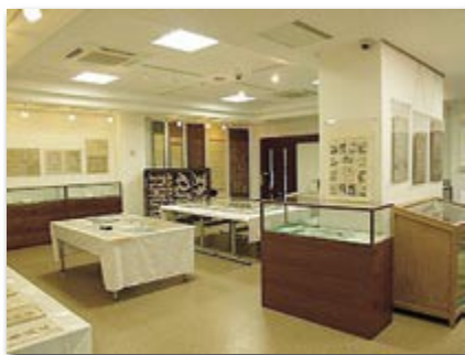
第6回企画展 「四国遍路が残した資料」